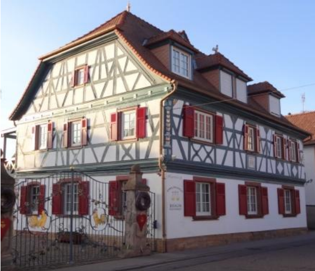
Foto: Restauriertes Fachwerkhaus von 1747 in Offenbach

Zum Ende der Barockzeit , also etwa 1765 wurden die Wohnhäuser, wenn finanziell möglich, massiv aus Steinen errichtet. Zum einen wollte man gewissen Wohlstand dokumentieren, zum andern waren die innerstädtischen Brände bei Fachwerkhäusern immer mit erheblichen materiellen Schäden und menschlichem Leid verbunden. Um den Eindruck zu erwecken, dass es sich um einen massiven Bau handelt, wurden auch in Offenbach schöne Fachwerkhäuser mit Putz überzogen oder massive Fassaden lediglich an der Straßenfront errichtet.