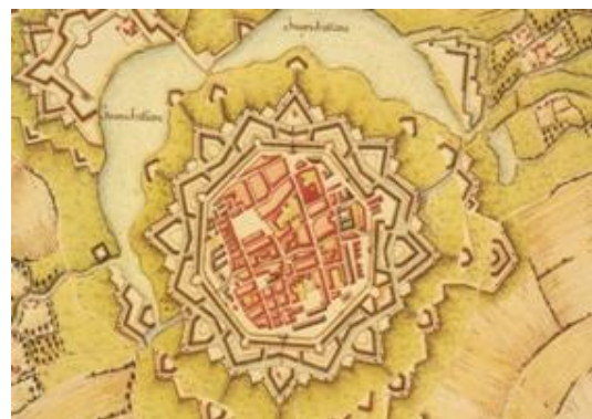
Queichlinie bei Offenbach um 1765

Im 18. Jh. setzt eine üppige Baukonjunktur ein, die die Stadt in barockem Stil völlig neu gestaltet. Die Altstadt mit ihren zahlreichen barocken Bauten, ihren von Wohlstand zeugenden großbürgerlichen Häusern und Villen ist damals neu entstanden. Interessant für Landau und Offenbach war, dass sehr viele Bauarbeiter aber auch Händler und Wirte, hauptsächlich durch steuerliche Vergünstigungen angelockt, aus dem französischen Sprachraum kamen, und sich hier nieder ließen.