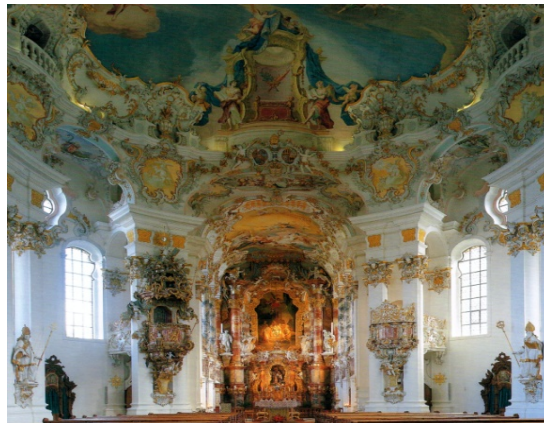
Barocker Kircheninnenraum der Wallfahrtskirche Birnau am Bodensee

Stadtplanungen von Karlsruhe, Mannheim, in Rastatt, Ludwigsburg und der Schlosspark in Schwetzingen